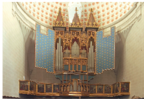
Orgue gothique de la collégiale Santa Maria de Dorca (Espagne)

Tel : 00 33 (0)4 90 66 04 16 Fax : 00 33 (0)4 90 66 12 62 e-mail : pascalquoirin@frcc.fr site : http://www.atelier-quoirin.com/