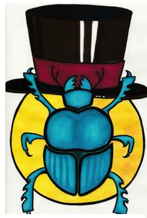
LOGO DU COLLECTIF S' CABARET

Dans le cadre de la soirée famille de la saison d'été 2018, le collectif du S'Cabaret vous invite à participer à son aventure théâtrale interactive déambulatoire ! Au programme de la soirée, énigmes, petits spectacles de conte, de mime et de clown musical à dénicher dans tout l'espace de l'église Saint-Pierre-Le-Jeune, décalquage des figures gravées sur le sol et autres surprises. L'entrée est libre à partir de 18h30, l'aventure se déroule en autonomie et dure environ une heure. Vous serez accompagnés dans votre quête par des animateurs qui vous guideront dans l'église. Un grand final rassemblant tous les artistes aura lieu à 21h15.